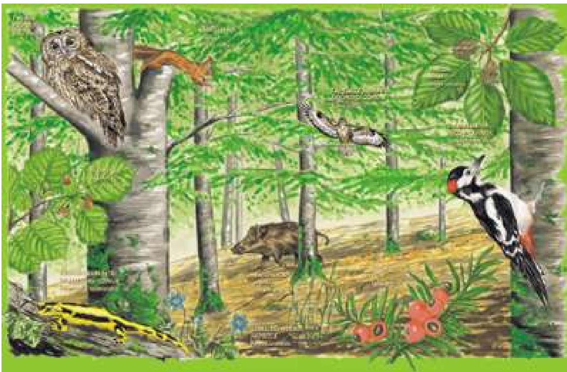
Imatge: Flora i fauna del parc natural d'Urkiola

El bosc caducifoli és un tipus de bosc temperat que es compon d'arbres caducifolis que perden les seues fulles tots els anys durant la temporada hivernal, freda i seca, i es renoven per a la temporada càlida i plujosa pròpia del clima continental humit , com és el cas de els boscos de roures, aurons, faigs i oms. Forma part del bioma anomenat bosc temperat de frondoses .